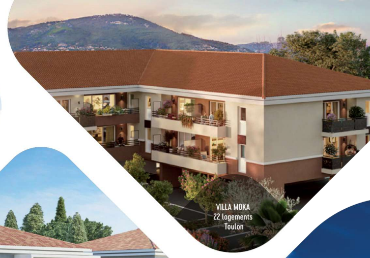
VILLA MOKA 22 logements Toulon