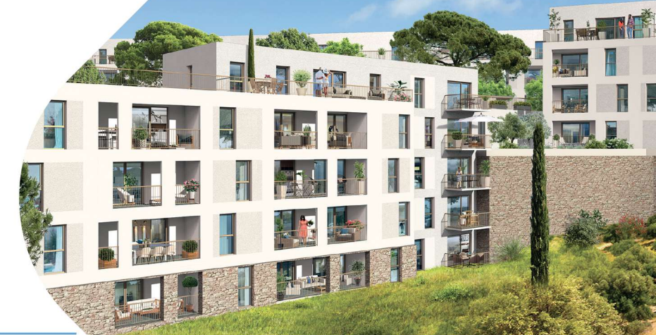
LES ESSENCES DE MARIE 43 logements Marseille