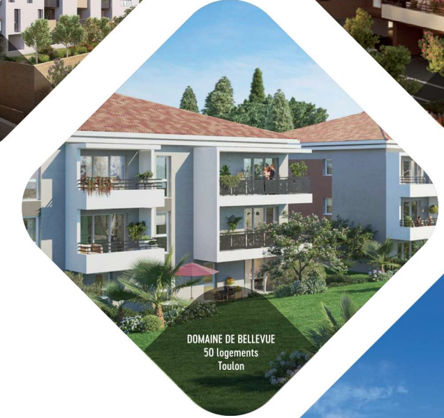
DOMAINE DE BELLEVUE 50 logements Toulon